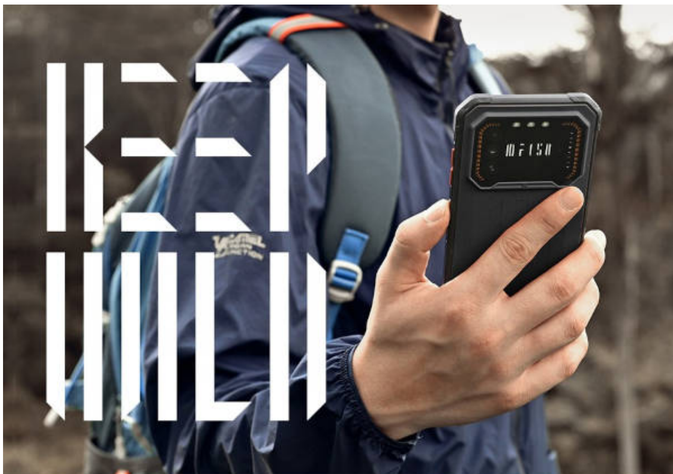
IIF150 | Ultra Thin Rugged Phone

Użytkownicy technologii mobilnych stawiają coraz wyższe wymagania swoim osobistym urządzeniom. Wysokie standardy odporności, funkcjonalności i awangardowego wzornictwa spełniają smukłe, a jednocześnie wzmocnione smartfony marki IIF150, które szybko zdobywają popularność wśród osób stawiających na trwałość i niepowtarzalny styl.