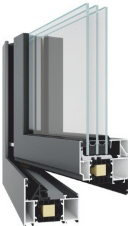
System TM 77HI

Złożona konstrukcja profili oraz możliwość zastosowania różnego rodzaju wypełnień gwarantują zachowanie właściwych współczynników izolacyjności cieplnej oraz obniżenie strat ciepła. Jest to szczególnie ważne w przypadku domów pasywnych i zeroenergetycznych. Gwarancją uzyskania doskonałych parametrów technicznych projektowanych konstrukcji z zakresu izolacyjności termicznej, akustycznej czy wodoszczelności jest system TM 77HI . To bezpieczny system okienny-drzwiowy, który pozwala na tworzenie okien i drzwi o dużych powierzchniach w różnych układach i konfiguracjach. System jest kompatybilny z pełną gamą oku dostępnych na rynku.