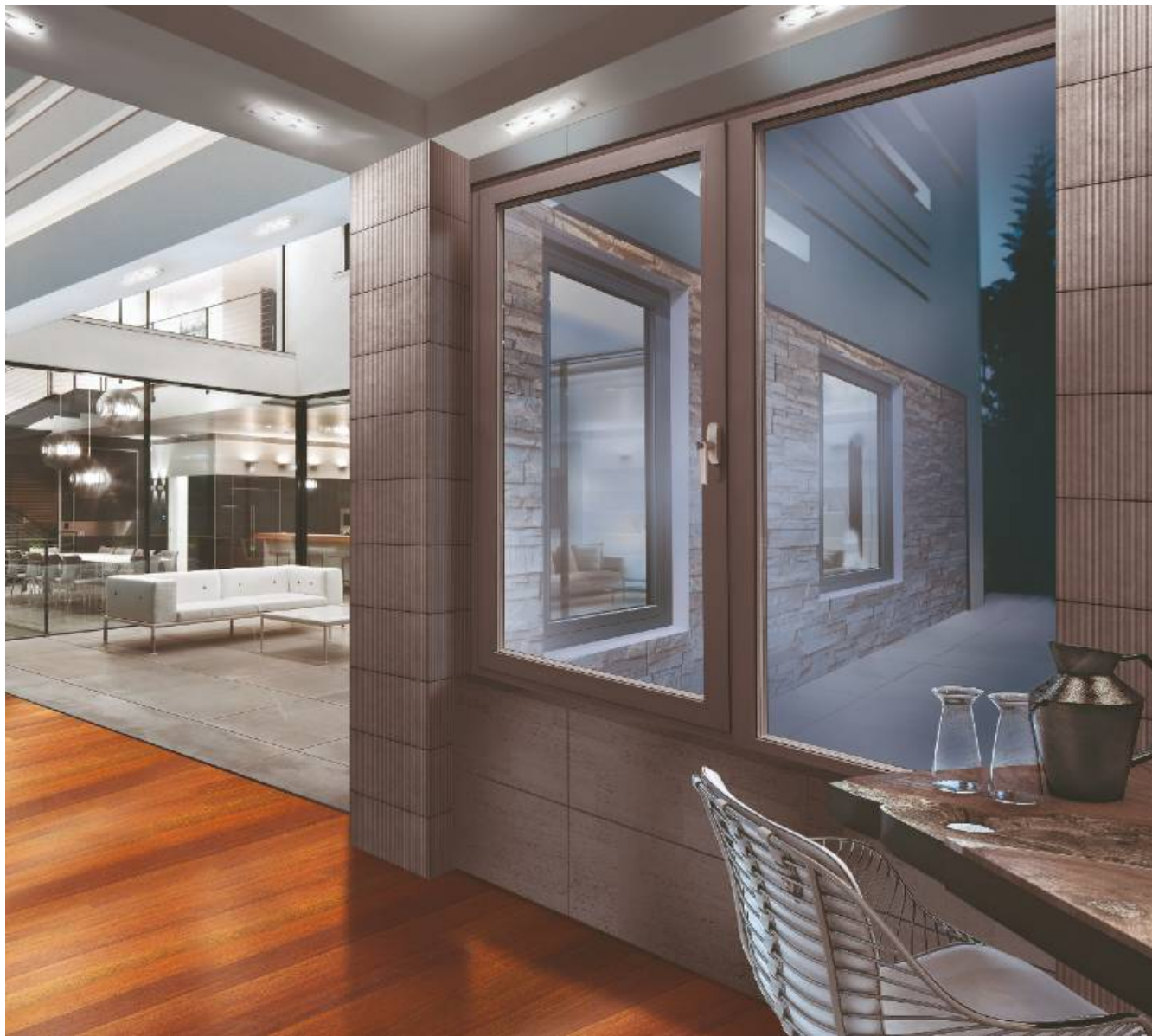
Okna antywłamaniowe RC 4

Energooszczędna, bezpieczna i trwała – to moim zdaniem cechy najlepiej określające stolarkę aluminiową, której stosowanie jest coraz bardziej dominującym trendem w architekturze, zarówno budynków publicznych, jak i prywatnych.