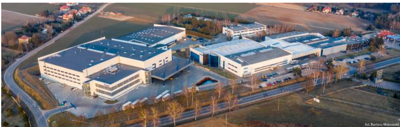
Siedziba Ponzio Polska Sp. z o.o

O konsekwencji w realizowaniu tej strategii świadczy między innymi najnowsza inwestycja w nowoczesne zaplecze produkcyjne, magazynowe i biurowe. Ciągłe powiększający się zespół kilkudziesięciu inżynierów w dziale technicznym oraz zaplecze w postaci laboratorium badawczego pozwala nam na szybkie tworzenie i testowanie nowych rozwiązań spełniających oczekiwania najbardziej wymagających klientów.