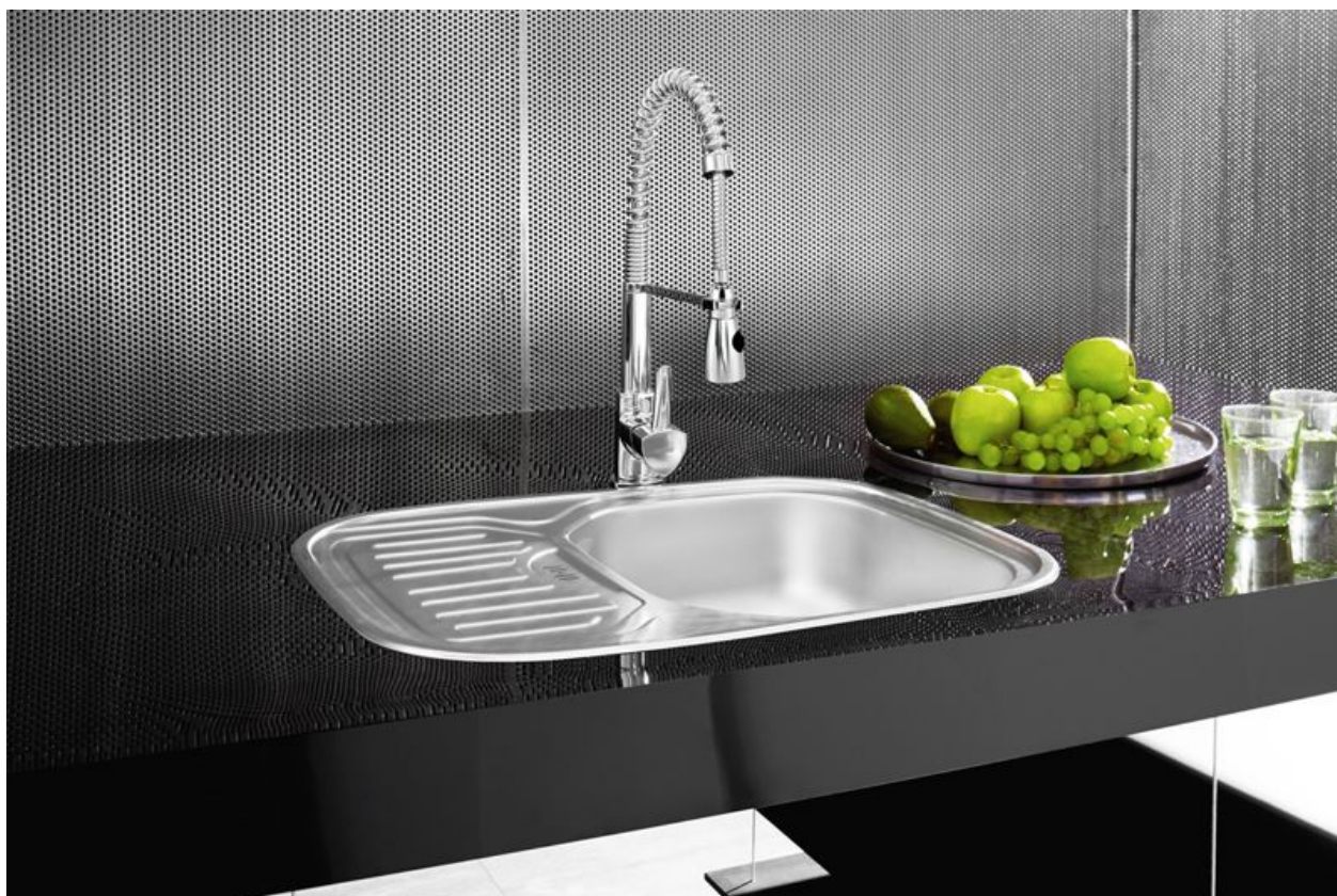
Modena - Bateria zlewozmywakowa stojąca z wyciąganym natryskiem. Zlewozmywak stalowy jednokomorowy, wpuszczany, len

Asti bateria zlewozmywakowa stojąca z wyciąganym natryskiem