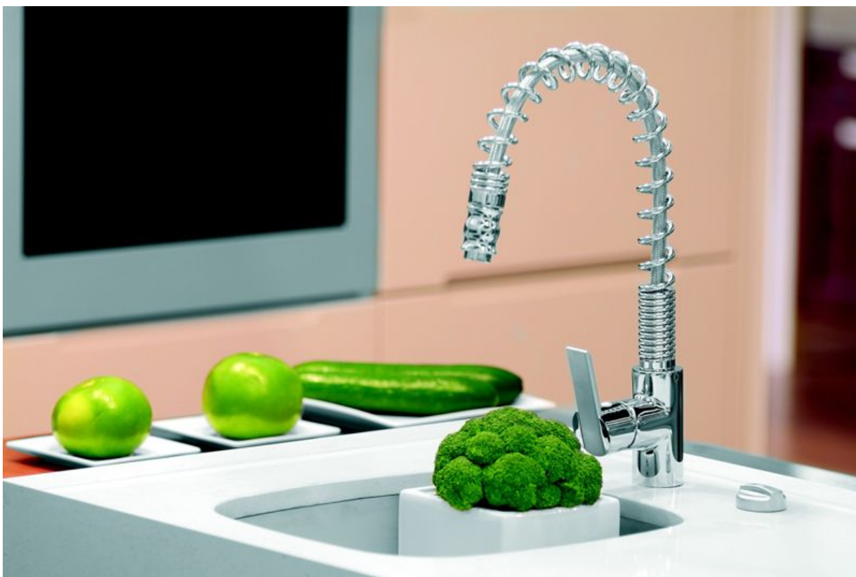
Spring bateria zlewozmywakowa BZP8 2