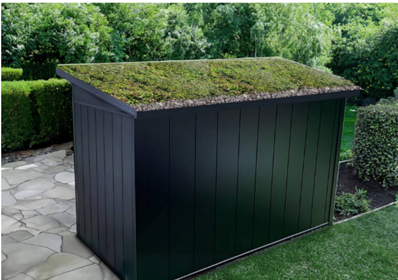
Domek ogrodowy „Berry”, wzór Modern z dachem jednospadowym wyposażonym w ramę, umożliwiającą pokrycie zielenią.