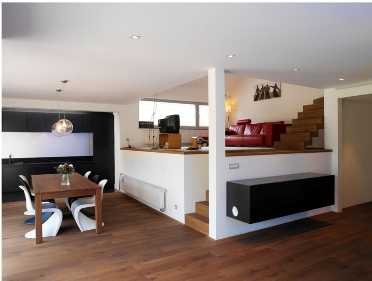
YTONG INTERIO- aranżacja wnętrza