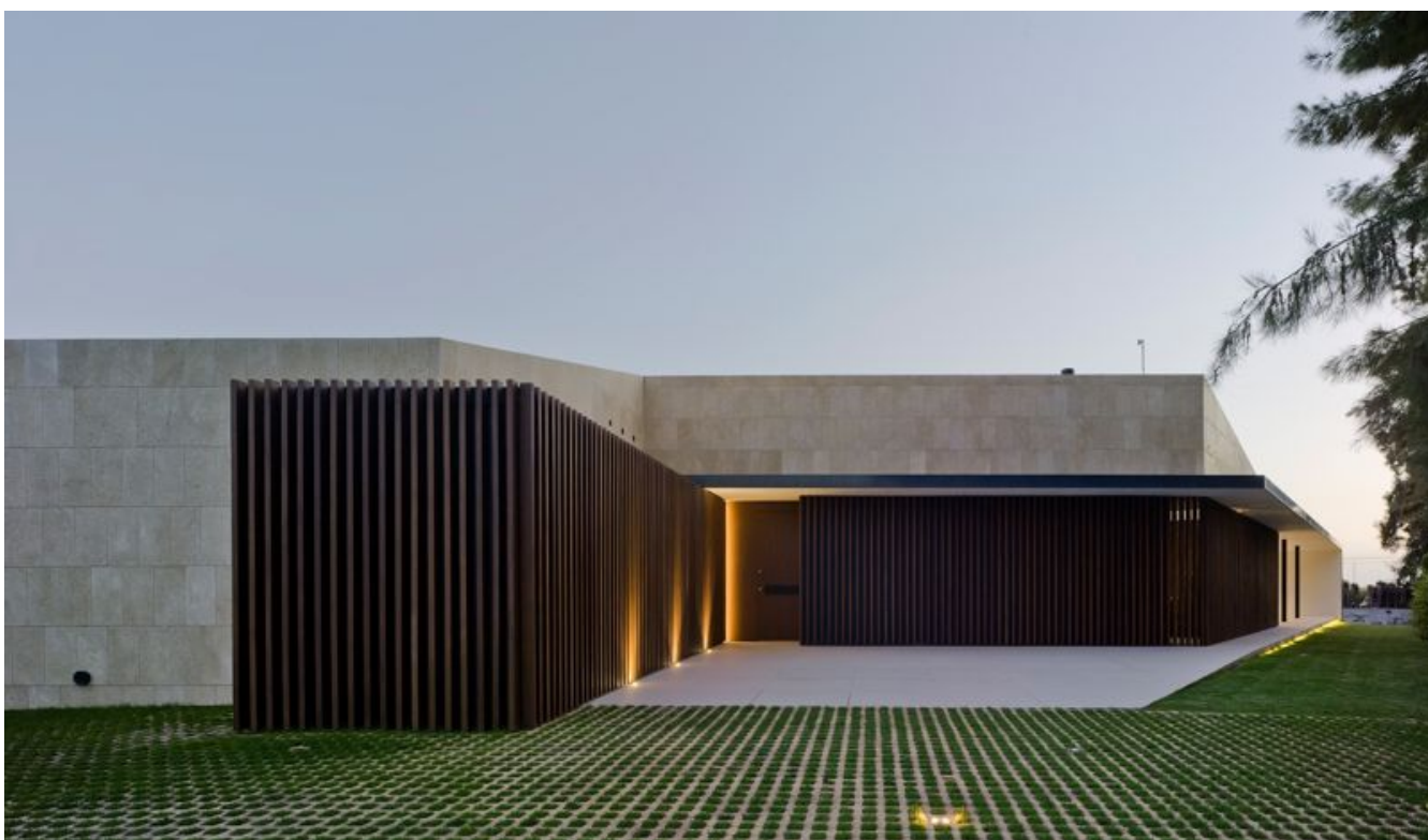
Budynek od strony północnej uzyskał zamknięty charakter

Decydujący wpływ na wybór rozwiązań konstrukcyjnych i wyposażenie stolarki miał śródziemnomorski klimat cechujący się łagodnymi zimami i gorącymi okresami letnimi. Platforma systemowa Schüco ASS 77 PD oferuje trzy wersje różniące się między sobą izolacyjnością cieplną, od wersji wysoko energooszczędnej SI (Super Insulated) poprzez energooszczędną HI (High Insulated) aż po nieizolowaną cieplnie NI (Non Insulated). W tym przypadku wybrano trzecią z nich, dedykowaną ciepłym strefom klimatycznym. Ponieważ w sezonie letnim może dochodzić do nadmiernego nagrzewania się wewnątrz, zastosowano specjalne pakiety szybowe z dwuwarstwową powłoką przeciwsłoneczną. Ponadto duże sekcje przesuwne umożliwiają mieszkańcom domu dostosowywanie położenia skrzydeł do zmiennych warunków atmosferycznych, np. w słoneczne dni mogą one być otwarte na oścież, a w chłodniejsze wieczory mogą pełnić funkcję naturalnej wentylacji w pozycji półotwartej. W celu zagwarantowania odpowiedniej ochrony przed włamaniem, systemy przesuwne i okna Schüco zostały wykonane w klasie RC2.