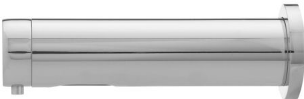
Bora Sensor- bezdotykowy dozownik do mydła w płynie

Nowoczesny design baterii, zaworów i dozowników pozwala na stworzenie spójnej aranżacji pomieszczeń sanitarnych, nie tylko efektownej wizualnie, ale również przynoszącej istotne ekonomiczne korzyści.