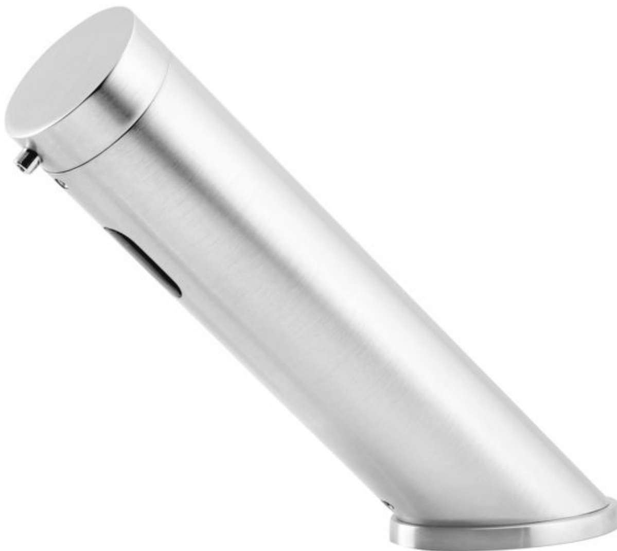
Mistral Sensor- bezdotykowy dozownik do mydła w płynie